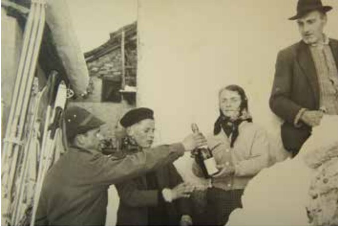
22 dicembre 1960 La consegna dei doni