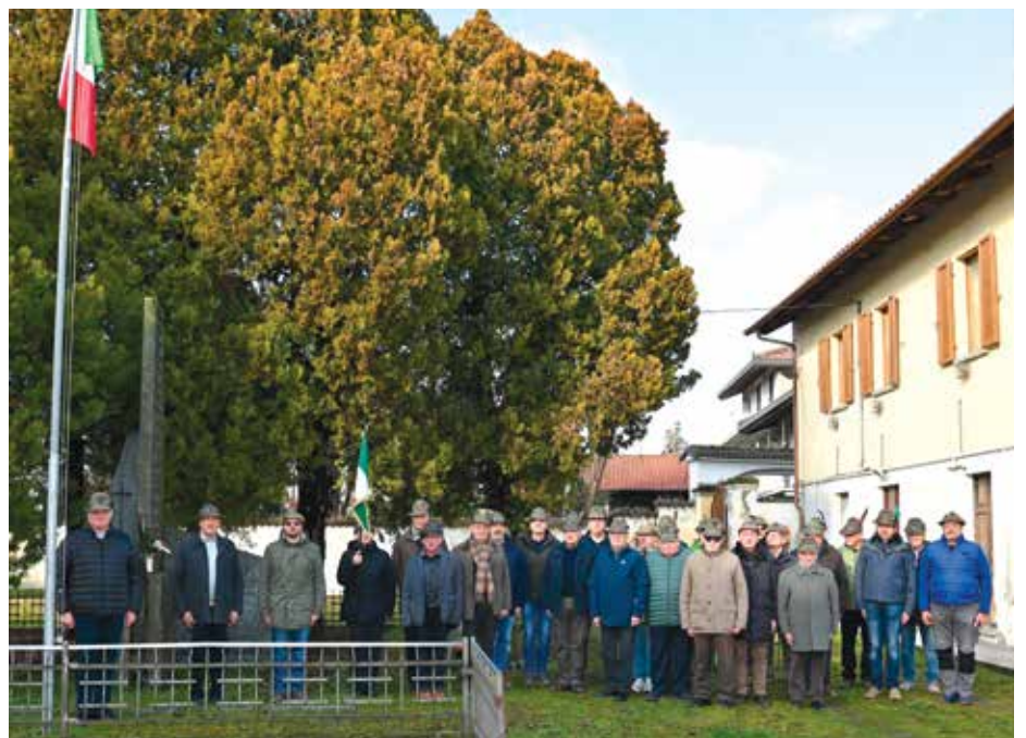
Baudenasca – Alzabandiera.