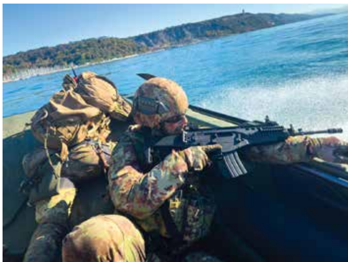
Addestramento con barchini del Genio

Il Corpo può inoltre contare sul sostegno dell'As-