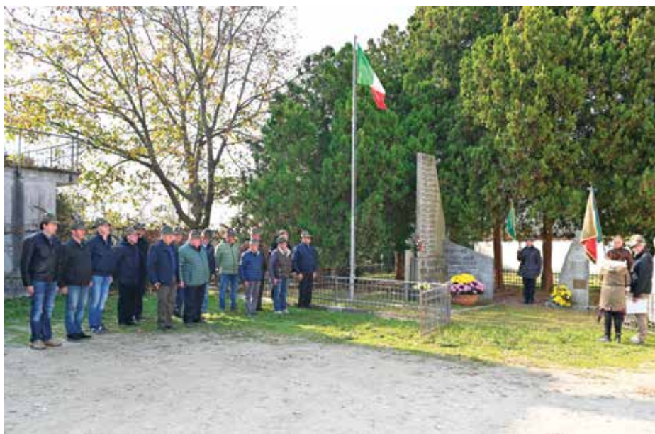
Baudenasca – Caduti 4 novembre 25.

Gli alpini del gruppo di Bricherasio nel corso dei mesi estivi hanno provveduto alla costruzione di un nuovo monumento. Davanti all'ingresso del cimitero 7 anni fa gli alpini avevano commissionato all'artista Fabio Moriena una scultura in legno raffigurante un combattente in occasione del centenario della fine della grande guerra. Detta scultura con gli anni si è deteriorata a causa degli eventi atmosferici. In concerto con l'amministrazione comunale il gruppo si è attivato a pensare ad una opera in pietra. Un bricherasiese, non alpino, ma generoso e volenteroso, ha offerto il materiale e il lavoro necessario alla realizzazione dell'opera. Gli alpini hanno demolito la scultura esistente e preparato il sito. Ispirati dalla colonna mozza dell'Ortigara si è proceduto alla costruzione di una colonna tronca recuperata in una vecchia chiesa. Di fronte esiste il monumento ai caduti sempre realizzato dal gruppo alpini nel 1972. È parso giusto in questo preciso momen-