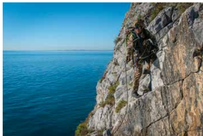
Addestramento alpinistico e al combattimento sulle scogliere di Duino