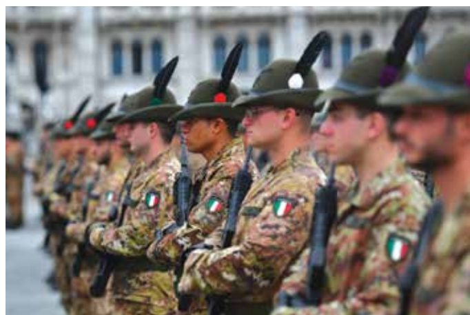
Alpini dopo aver ricevuto il cappello alpino