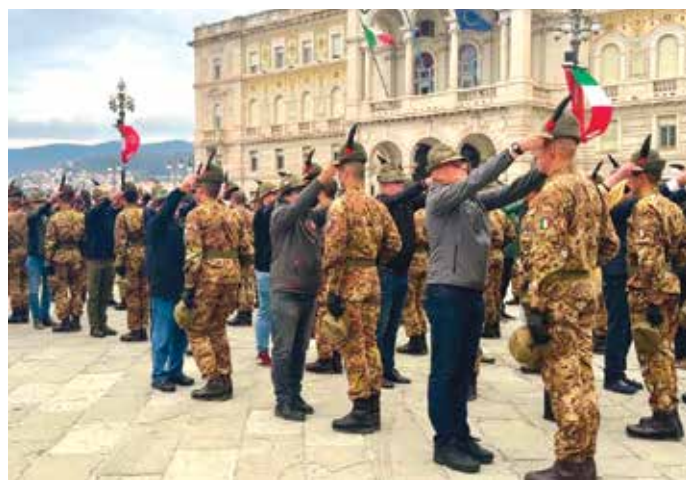
Consegna del Cappello ai nuovi Alpini

I neo-Alpini appartenenti al corso “Monte Nero III” hanno così concluso un periodo di dodici settimane di formazione presso il Centro Addestramento Alpino di Aosta, durante il quale hanno frequentato il Modulo Integrativo Truppe Alpine, un impegnativo percorso fisico e tecnico, comprendente i corsi basilari di alpinismo e di combattimento in montagna, dove sono state apprese le tecniche per vivere, muovere, combattere e soccorrere in ambiente montano. Successivamente, a Trieste, si è tenuta una settimana di formazione ed eventi culturali realizzata in collaborazione con la Regione Friuli