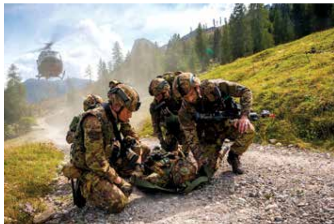
Soccorso a militare ferito

Protagonisti dell'attività addestrativa concepita e guidata dal Comando delle Truppe Alpine di Bolzano sono stati gli uomini e le donne della Brigata alpina Taurinense (2°, 3° e 9° reggimento alpini, Nizza cavalleria, 32° reggimento genio guastatori, 1° reggimento artiglieria terrestre da montagna), e Brigata alpina Julia (5°, 7° e 8° reggimento alpini, 2° reggimento genio guastatori, 3° reggimento artiglieria terrestre da montagna, Piemonte cavalleria), supportati da assetti del Centro Addestramento Alpino di Aosta, reggimento logistico Julia, 4° reggimento Altair dell'Aviazione dell'Esercito e 2° reggimento trasmissioni alpino.