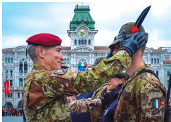
Il comandante delle Forze Operative Terrestri consegna il cappello alpino al 1° classificato del corso