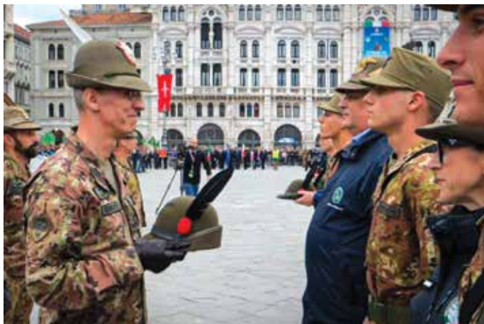
Il Comandante delle Truppe Alpine consegna il cappello alpino al 2° classificato del Corso