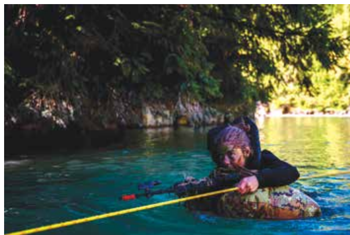
Guado lago Soraga

La "Extreme Patrol" si è integrata nelle attività addestrative della brigata Julia nell'ambito della Allied Reaction Force (ARF) della NATO ed è stata federata all'esercitazione "Vipera 25" dell'Aviazione dell'Esercito, svoltasi parallela-