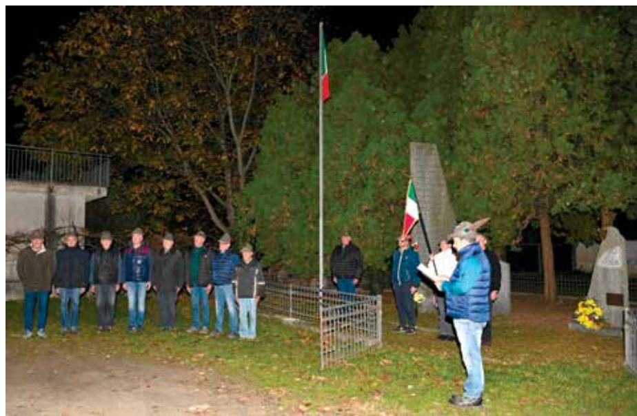
Baudenasca – Caduti 4 novembre 25 sera.

La mattina di domenica 9 novembre il gruppo Alpini di Baudenasca si è nuovamente radu-