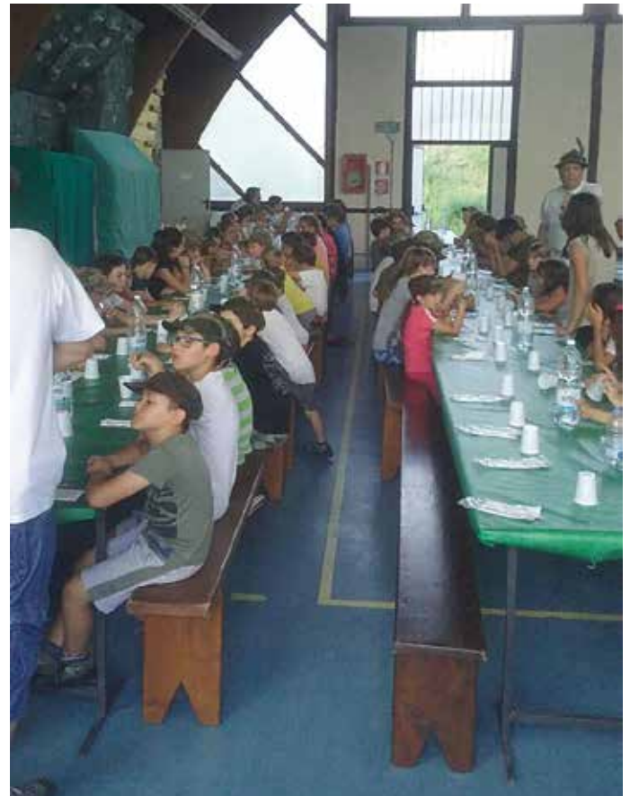
Il rancio meritato