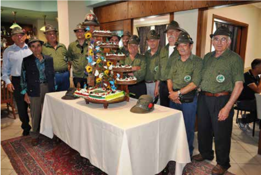
Alcuni soci con la torta