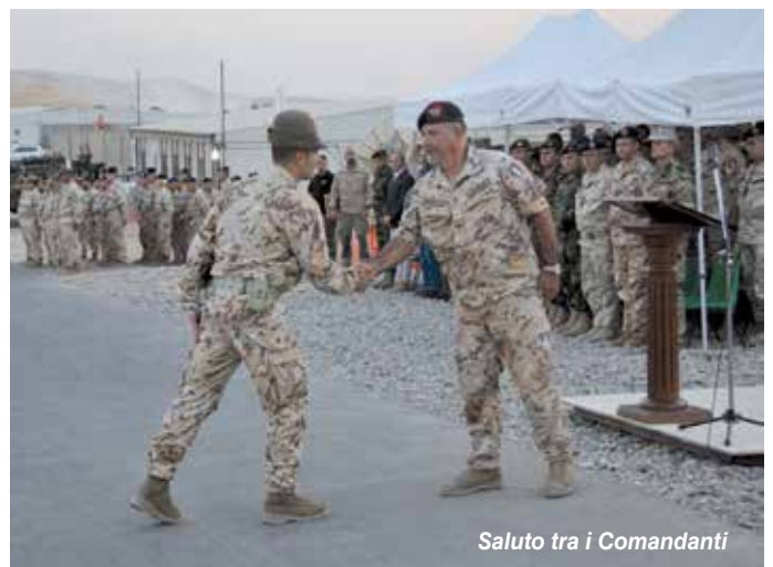
Saluto tra i Comandanti

L'Italia partecipa all'Operazione "Inherent Resolve" - secondo contributore dopo gli USA - con la missione nazionale "Prima Parthica": 1400 militari circa appartenenti a tutte le Forze Armate, impiegati, oltre che presso la Diga di Mosul, nelle sedi di Baghdad e Erbil nell'addestramento delle Forze di Sicurezza curde (Peshmerga) ed irachene ed assicurando a tutta la coalizione, con un Task Group aeromobile dislocato presso l'aeroporto di Erbil, la capacità di Personal Recovery (PR) nel quadrante settentrionale del teatro iracheno.