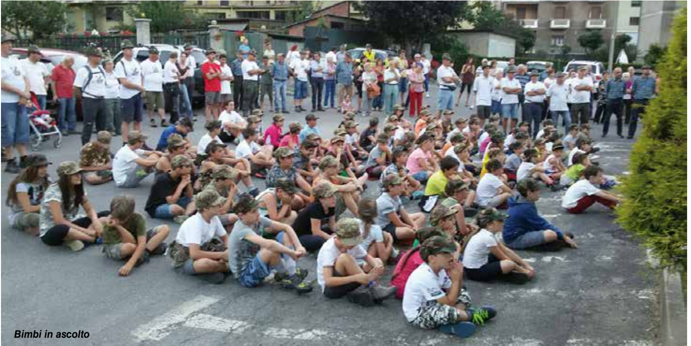
Bimbi in ascolto

tamente per far divertire i piccoli Alpini, ma, in particolare, per offrirgli un momento di aggregazione e di formazione che possa esser loro utile nella loro crescita. A tal proposito, hanno effettuato esercitazioni che richiedevano il lavoro di squadra per poter raggiungere l'obiettivo.