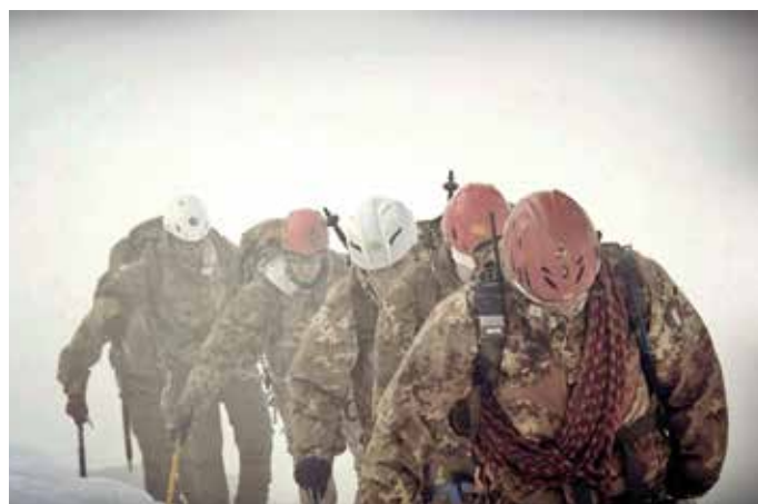
Traguardo sempre più vicino

mezzo di gennaio e culminate con il raid scialpinistico della Brigata Alpina "Taurinense", il 3° Reggimento Alpini ha concepito, organizzato e condotto il Corso Base Alpinistico di reparto. L'addestramento, che ha coinvolto 40 militari tra istruttori e allievi per sei settimane, è stato svolto in alta Val Chisone e Val di Susa ed è culminato con la fase ghiaccio in Val d'Aosta.