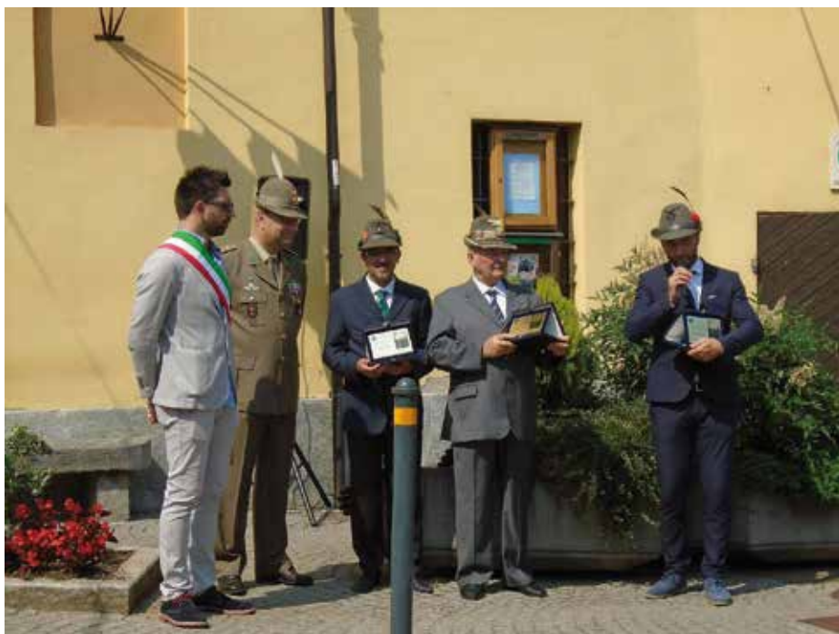
Scambio delle targhe