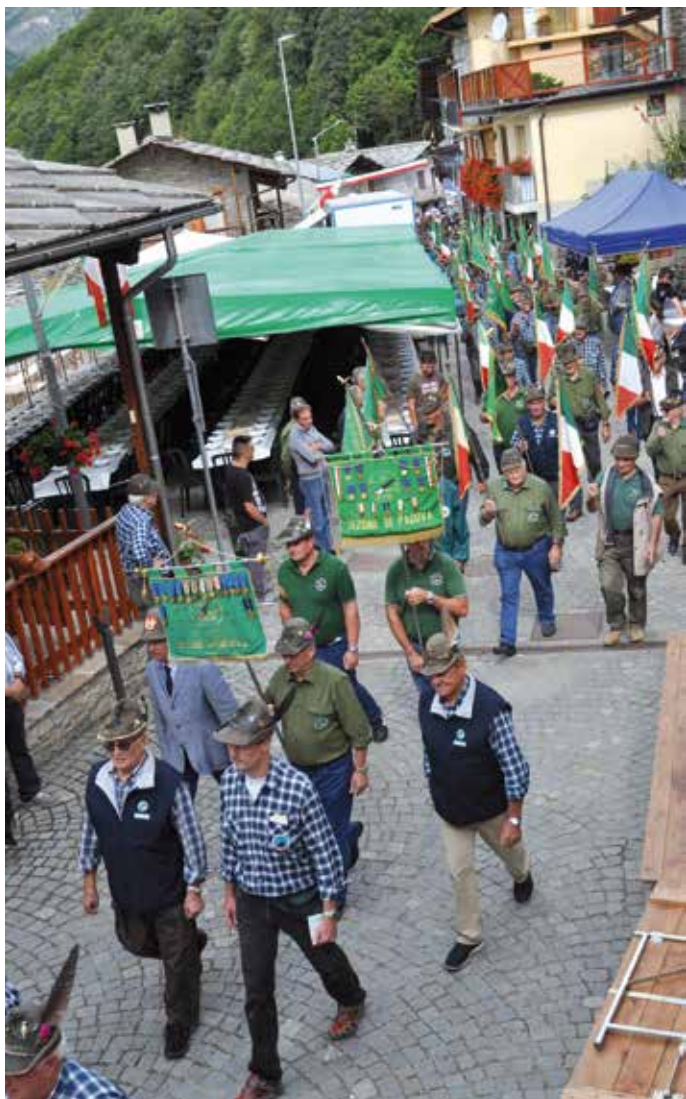
Il vessillo sezionele ad Ostana