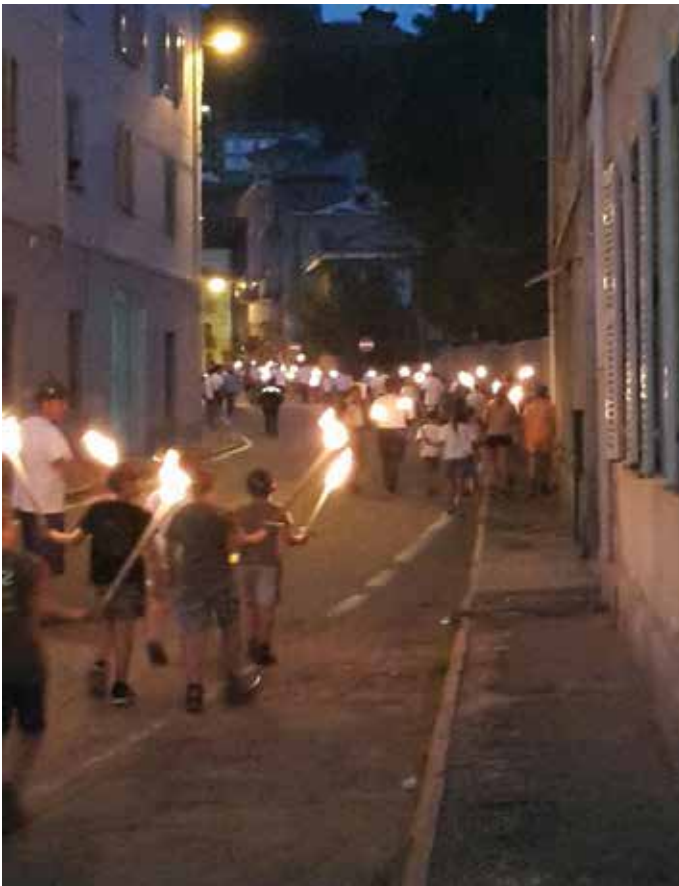
La Fiaccolata dei piccoli Alpini

Gli esercizi aerei sono stati attrezzati con materiale rinvenuto sul luogo e con l'impiego di ottimi dispositivi di sicurezza. Quest'ultimi resi necessari dall'altezza alla quale si sono svolte le esercitazioni. Si pensi che il ponte tibetano, primo dei vari esercizi, era situato ad un'altezza di circa 5 metri dal suolo. Anche