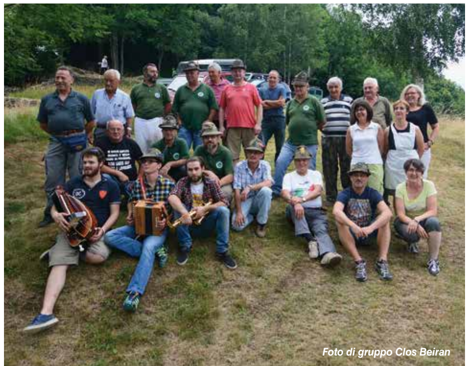
Foto di gruppo Clos Beiran

La partecipazione alla Adunata Nazionale a Treviso è stata organizzata in collaborazione con il gruppo di Carmagnola e Polonghera con un viaggio in Bus della durata di tre giorni, visitando le zone Turistiche al sabato e il lunedì... e partecipando alla Grande Sfilata alla Domenica. Una ricca cena al ritorno ha concluso questa bella gita, facendo rimpiangere la grande Accoglienza, l'Ospitalità e la Disponibilità della Gente di Treviso.