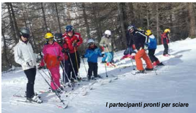
I partecipanti pronti per sciare

Possiamo ora domandarci: "il canto di montagna esiste davvero?", o è solamente canto "per" la montagna e, "canti degli alpini sono veramente tali?", o canti "preferiti" dagli Alpini, come ha detto e scritto