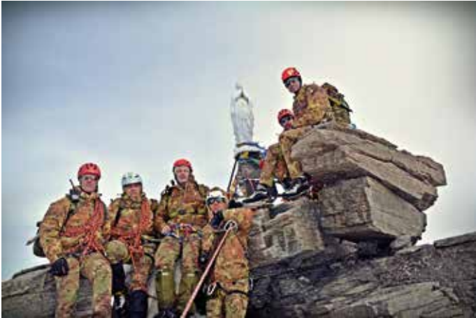
In vetta al Gran Paradiso

della formazione tecnica ma anche morale e caratteriale del personale.