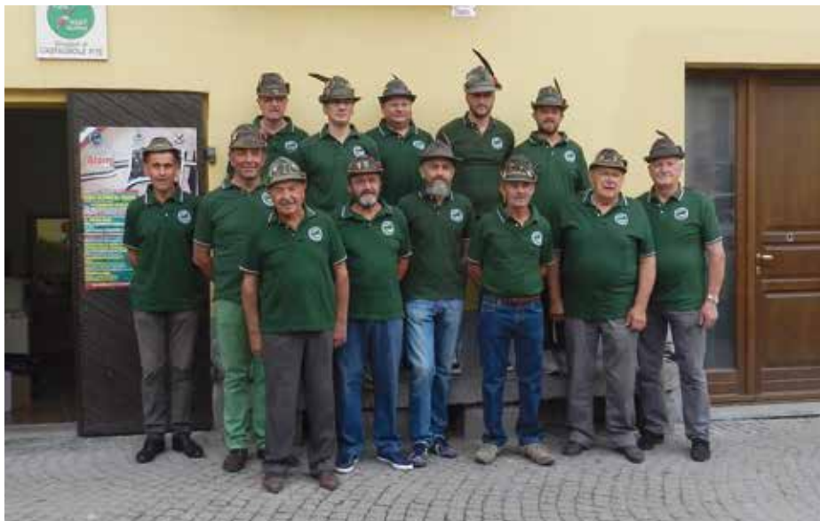
Il Gruppo riunito