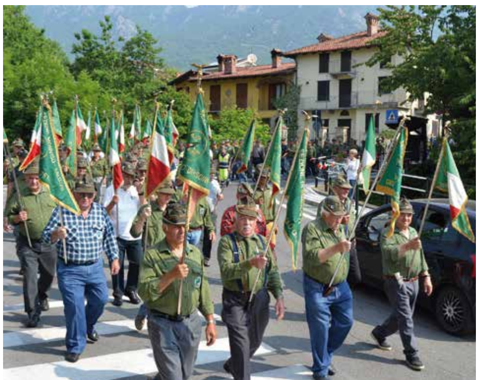
Durante la sfilata