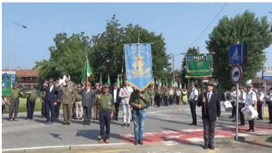
Onore ai Caduti