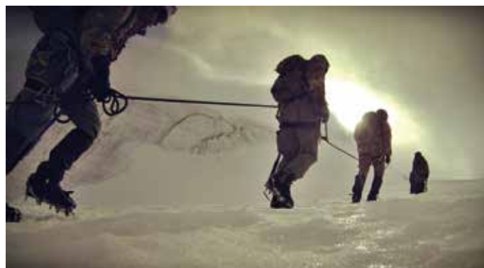
Salendo al Gran Paradiso

Nell'ambito delle attività addestrative di specialità volte ad elevare la capacità di vivere, muovere e combattere in media e alta montagna iniziate già nel