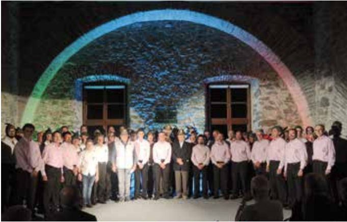
Il concerto dei cori

in varie occasioni Bepi De Marzi: “la guerra non da canti, non ha mai dato canti”. Nel tempo la trasformazione prese corpo nel nuovo modo di cantare insieme, capace di riaffermare il valore del canto come esperienza viva e condivisa, espressione di libertà e di umanità. Questo stesso valore reclamano le più facili e coinvolgenti composizioni moderne di ispirazione popolare.