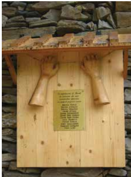
La targa commemorativa

Sabato 1 luglio 2017 è stata inaugurata a Vrocchi di Bovile (Perrero), nel Parco della Rimembranza, una lapide in memoria degli abitanti delle borgate, deportati nei campi di concentramento nazisti in Germania durante la seconda guerra mondiale.