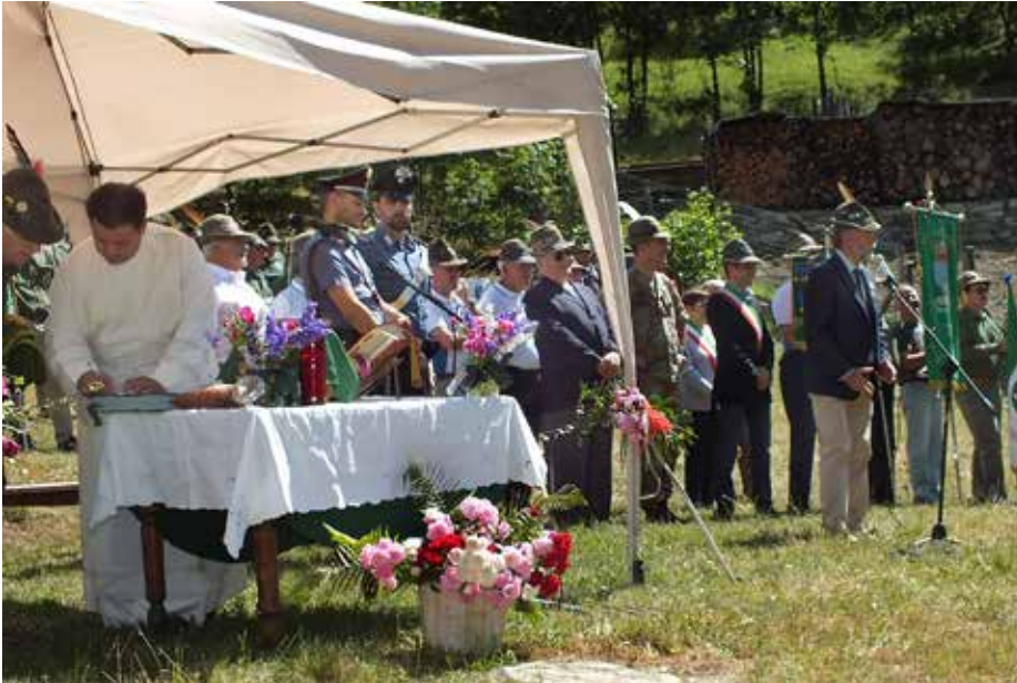
Saluto ai partecipanti

481 dispersi. Il 22 novembre venne sciolto ed incorporato nel Batt. Borgo S. Dalmazzo.