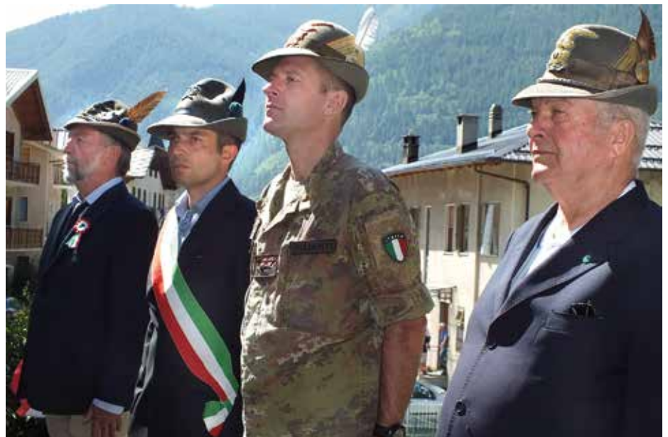
Onore ai Caduti