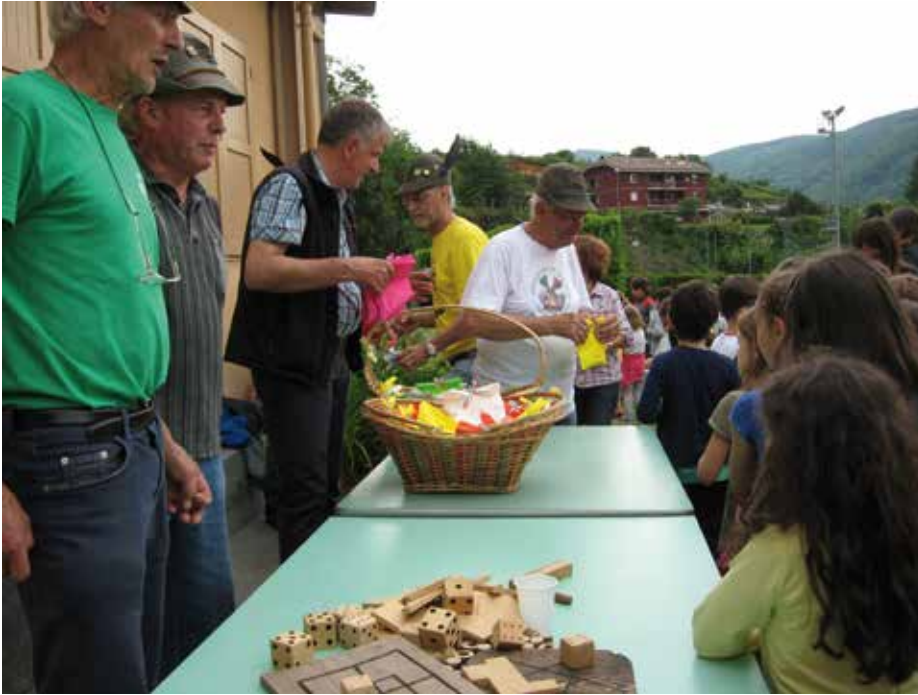
Giocando con i bimbi

curamente cercheremo di fare. Un grazie anche alla disponibilità della direzione didattica e la collaborazione delle maestre.