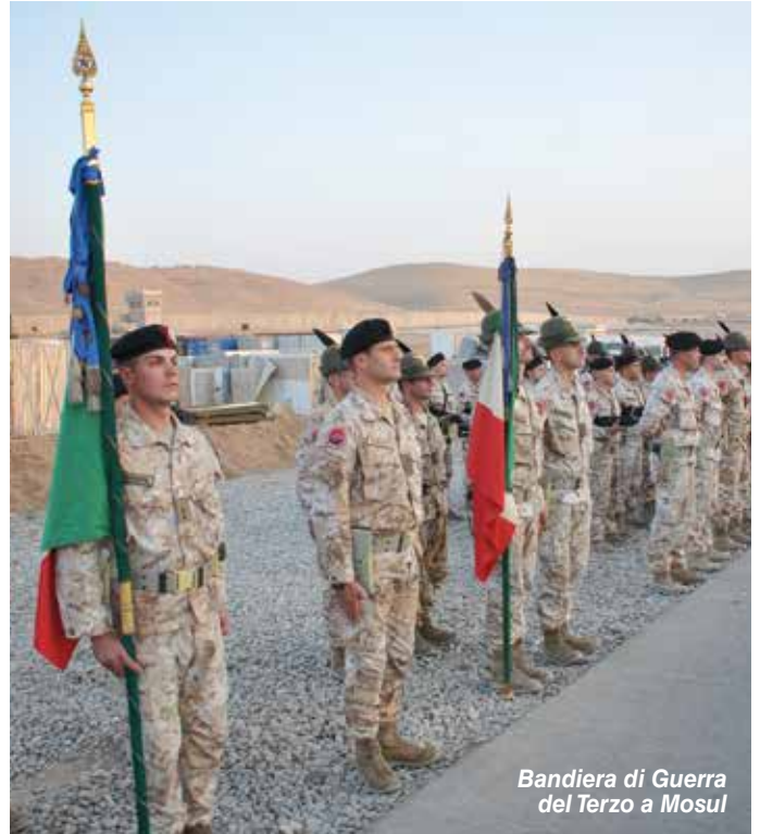
Bandiera di Guerra del Terzo a Mosul